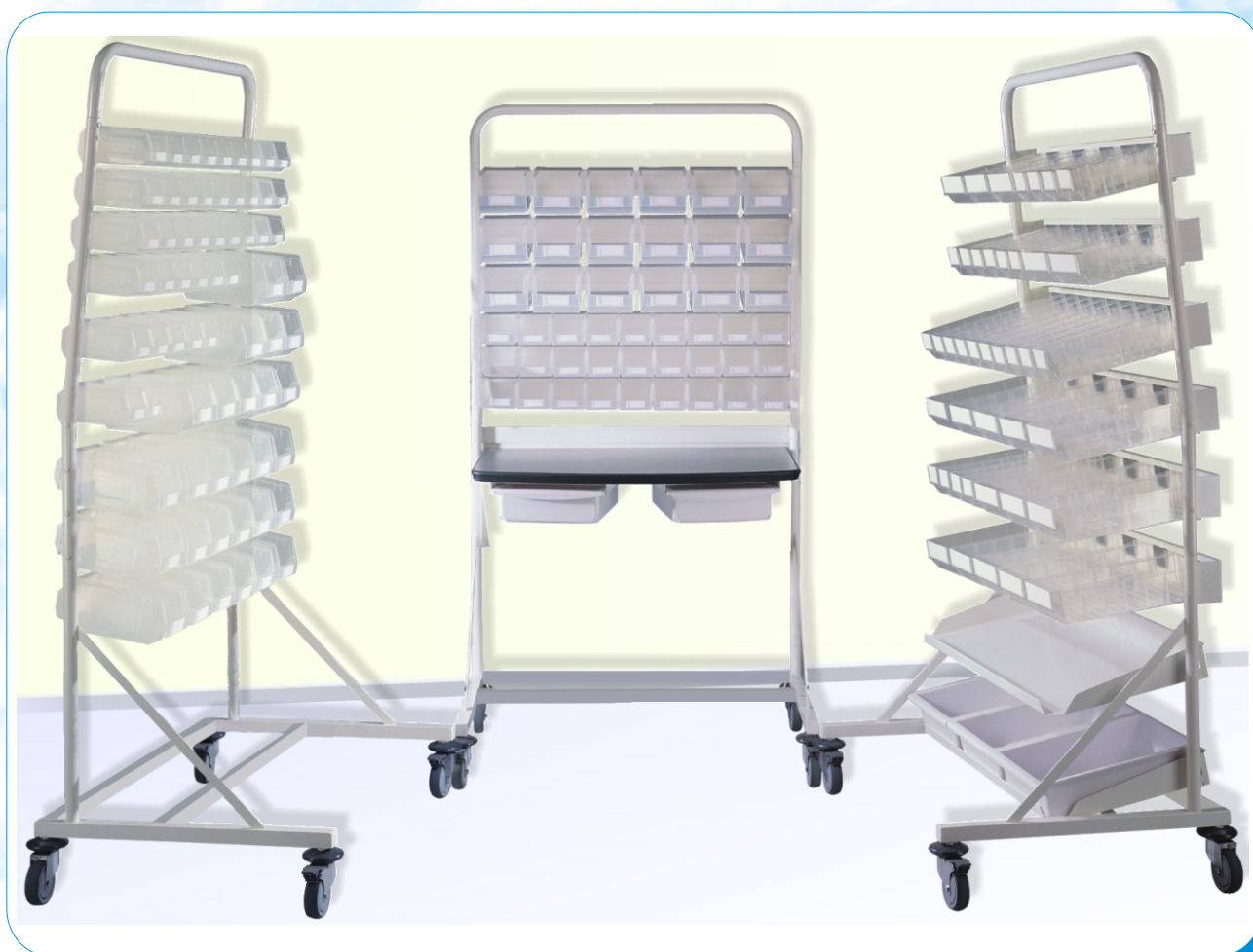
Exemples d'aménagement de postes de cueillette

Le poste de cueillette mobile PraticDose® est spécialement conçu pour faciliter la préparation des médicaments en pharmacie. Composé de 3 types de bacs différents (bacs à bec, bacs divisibles, bacs tiroirs) compatibles avec les gammes Armoires à pharmacie, Modulo, Hebdo et Ipoméa, le poste de cueillette PraticDose® est essentiel à la gestion du circuit du médicament.