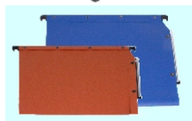
Dossiers suspendus à Lecture verticale format A4 (entraxe 330) format A3 (entraxe 450)