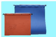
Dossiers suspendus à Lecture horizontale format A4 (entraxe 330) format A3 (entraxe 450)