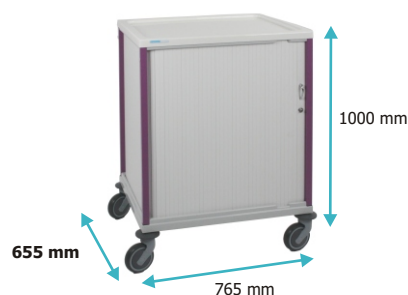
Chariots pour dossiers radios / format A3

Ces chariots sont proposés avec 2 types de rangement possibles: