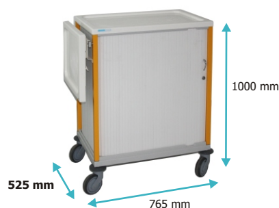
Chariots pour dossiers médicaux / format A4