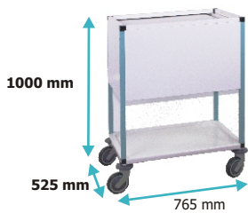
Chariots pour dossiers médicaux / format A4 - fermeture à rideau