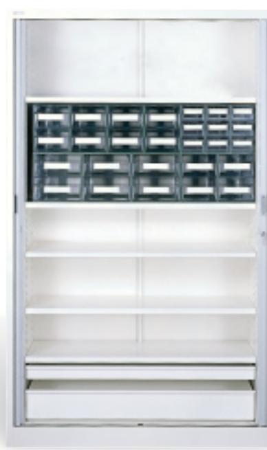
Armoire pour dispositifs médicaux