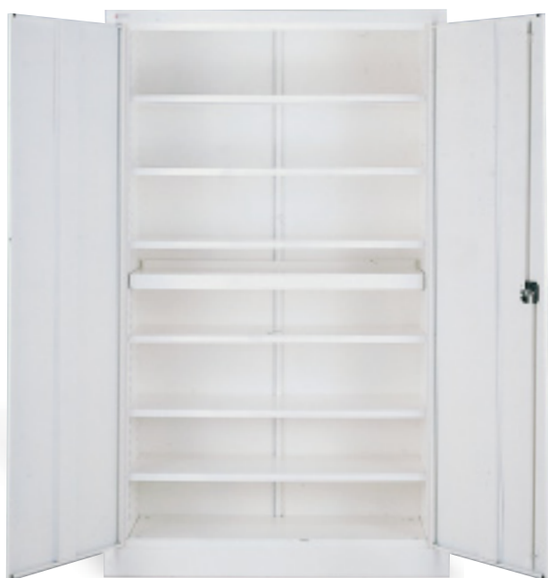
Armoire à portes battantes