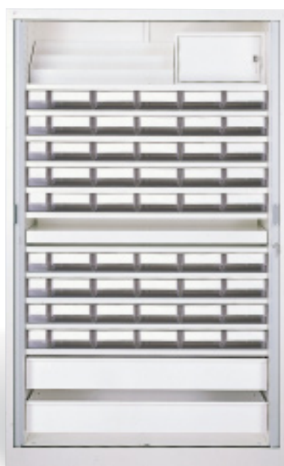
Armoire long séjour pour une gestion nominative de 45 résidents