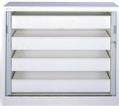
Armoire petit modèle

*existe avec fermeture à 2 portes battantes (Réf. 76121)