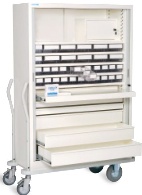
Armoire mobile de transfert

PraticDose® met à votre service son support technique afin de vous aider à définir votre aménagement idéal, grâce à des simulations informatisées.