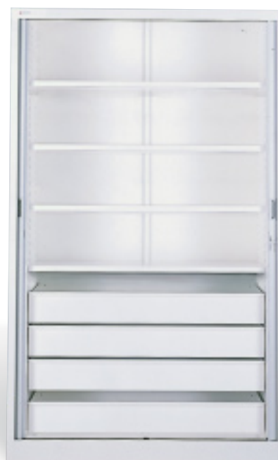
Armoire à solutés